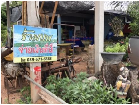
มีป้ายบอกเส้นทางหลายจุด