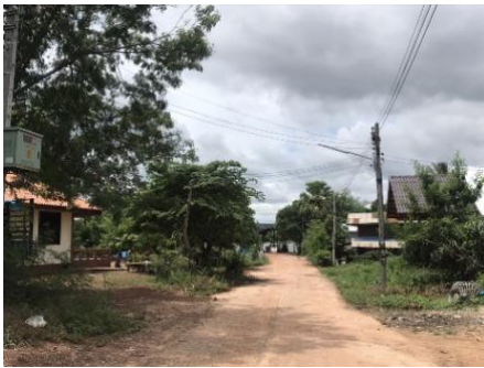
มีไฟส่องสว่างหลายจุด