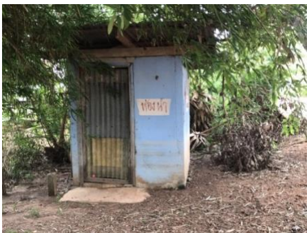
มีห้องน้ำ และถังขยะ