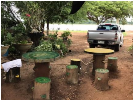
มีโต๊ะ เก้าอี้ ไว้บริการนักท่องเที่ยว

โดยบริเวณแพข้ามฟาก จะมีที่พักผ่อนหย่อนใจ ห้องน้ำ และ ถังขยะ ไว้บริการนักท่องเที่ยว และตลอดเส้นทางจะมีป้ายบอกเส้นทางหลายจุด